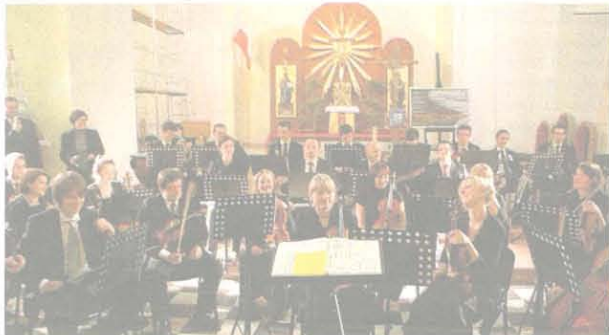
Skierniewicka Orkiestra Kameralna zagrała już w kościele garnizonowym rok temu

► W ten weekend odbędzie się Skierniewicka Jesień Muzyczna. Kto będzie tegoroczną gwiazdą festiwalu?