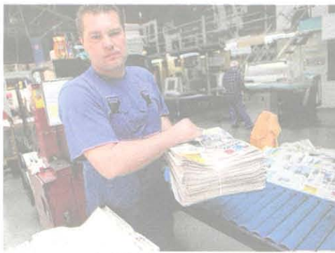
Kupując prenumeratę „ITS”, można czytać gazetę do porannej kawy

Co zrobić, żeby podwójnie wygrać? W terminie do 20 listopada trzeba wykupić roczną prenumeratę „ITS” z bezpłatną dostawą do domu. Roczna prenumerata w tym okresie kosztuje tylko 99 zł, a zakupu można dokonać w biurze ogłoszeń „ITS” przy ulicy Batorego 21 w Skierniewicach. Oferta jest skierowana wyłącznie