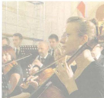
Warto wybrać się na koncert i w najbliższą niedzielę