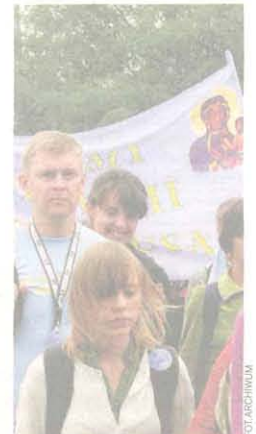
Co roku w łowickiej pielgrzymce uczestniczą setki wiernych