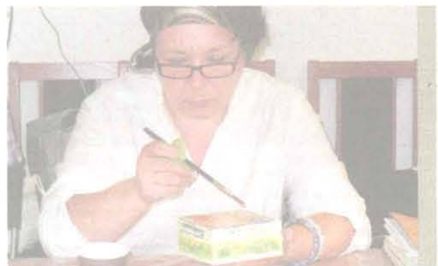
Postarzanie drewna metodą decoupage to bardzo relaksujące zajęcie