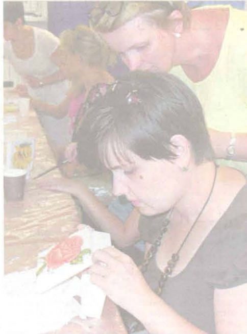
Również w ostatni weekend kilkanaście pań uczestniczyło w warsztatach