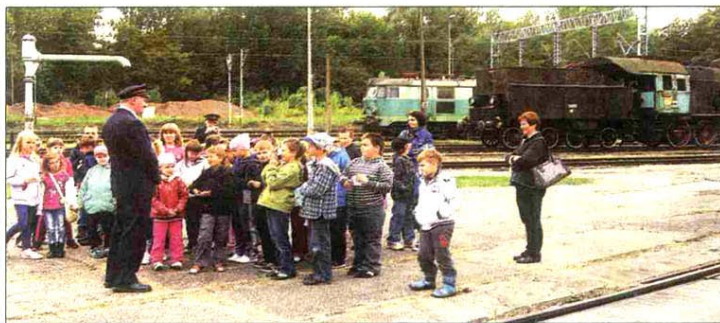
W drugi weekend nowego roku szkolnego (13.09), w Parowozowni odbył się specjalny dzień otwarty dla uczniów i przedszkolaków. Dzieci miały szansę zapoznania się z podstawowymi zasadami bezpiecznego zachowywania się w pociągu i na terenach kolejowych.

Patrząc na liczbę gości odwiedzających skierniewickie muzeum kolei, rzec można, że jest to jedno z najchętniej wybieranych miejsc rekreacji w mieście i to nie tylko przez skierniewiczian, także przez turystów. Wpływ na to mają niewątpliwie wciąż nowe, różnorodne propozycje imprez wprowadzane do oferty Parowozowni. Tylko podczas minionego weekendu na jej terenie odbyły się specjalne dni otwarte dla uczniów oraz organizowane z okazji Święta Kwiatów.