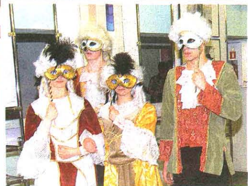
Występ Akademii Tarica „4-20” w barwnym widowisku „Wenecja”.