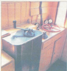
Stanowisko motorniczego w akumulatorowym Wittfeldzie.