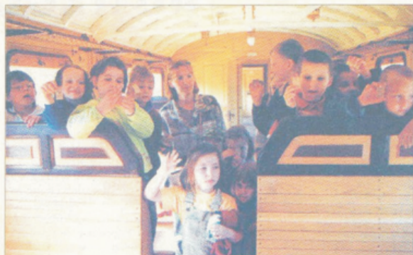
„Króliczki” w wagonie 3 kl. zabytkowego zespołu Wittfeld (1913 r.).

Od lat członkowie Polskiego Stowarzyszenia Miłośników Kolei gromadzą tam zabytkowy tabor kolejowy. Wśród eksponatów jest wiele perełek kolejnictwa. Ściągnięte z całej Polski wagony i lokomotywy stoją zwykle zamknięte za potężnymi drzwiami. W tym czasie miłośnicy kolei gromadzą ich dokumentację, spisują ich historię. Własnymi siłami remontują to, co potrafią. Szukają sponsorów napraw i generalnych remontów zabytkowych pojazdów.