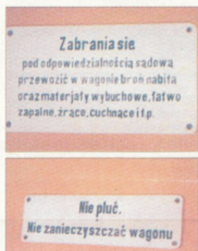
Takie napisy wieszano w wagonach jeszcze w latach 50.