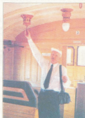
Wnętrze Wittfelda odbudowane zostało z dużym pietyzmem.