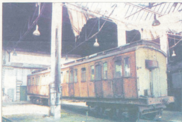
Jedyny zachowany w Polsce czteroosiowy „bocznik” 1 i 2 kl. (rok budowy ok. 1912).