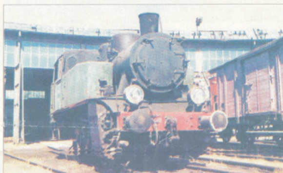
Przemysłowe parowozy typu Ferrum były używane w wielu fabrykach.