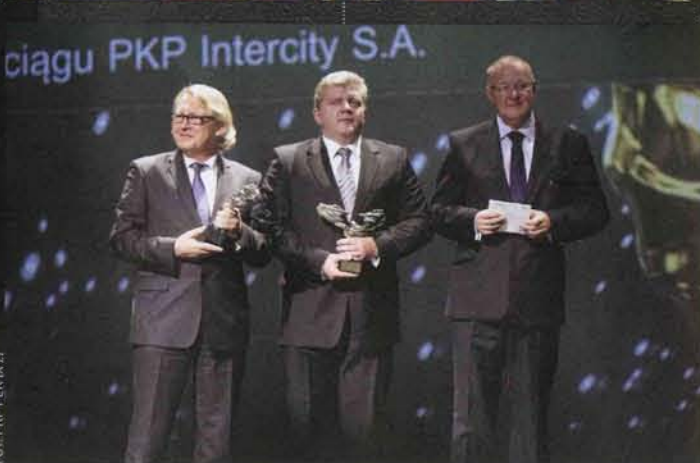
FOT. PKP PLK IX 21