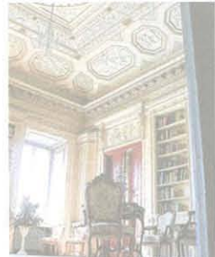
Pałac Prymasowski jest perłą skierniewickich zabytków

sansowy. Po I wojnie światowej zajęła go Szkoła Główna Gospodarstwa Wiejskiego w Warszawie. W 1951 roku pałac stał się siedzibą Instytutu Sądownictwa, zaś w 1964 – Instytutu Wazrywnictwa. W tym samym czasie rezydencji przywrócono cechy stylu późnego baroku i zmieniono wygląd elewacji.