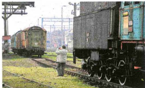
Skierniewicka parowozownia może się pochwalić bogatymi zbiorami

i części hali głównej oraz w wnętrzach wybranych ekspozycji – pod opieką członków i wolontariuszy PSMK. – Po zakończeniu imprezy zapraszamy wszystkich uczestników do udziału w konkursie na najlepsze fotografie pleneru – zachęca Judyta Kurowska-Ciechańska, przewodnicząca ZG PSMK.