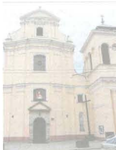
W tym roku przypada 400 lat od zał. fundacji na rzecz kościoła

Kościół jest trójnawowy i mury. Został zbudowany w stylu baroku jezuickiego. Posiada siedem ołtarzy. Dedykowany patronce kościoła ołtarz główny, z rzeźbami świętych i wyraznymi cechami baroku, pochodzi z pierwszej połowy