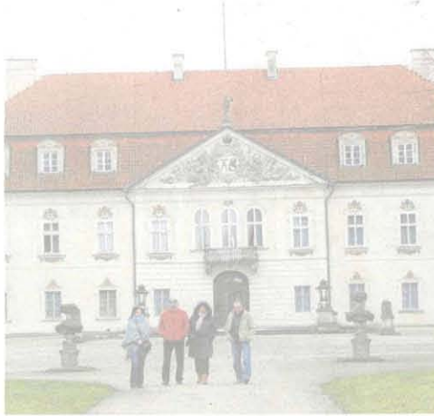
Pałac w Nieborowie przez cały rok przyciąga tysiące turystów

Turystom, którzy przyjeżdżają do Nieborowa, od razu