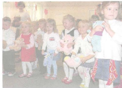
Dzień Pluszowego Misia obchodzono w Przedszkolu nr 5...

• Fotorelacje na www.skierniewice.naszemiasto.pl