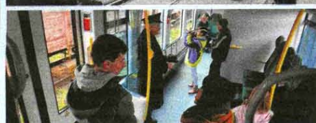
Widzowie dopisali, a atrakcją był przejazd nowoczesnym wagonem