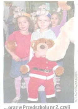
...oraz w Przedszkolu nr 2, czyli w Stoneczku