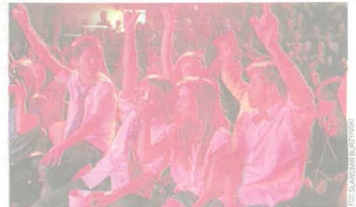
A widownia w kinie Polonez szalala, oklaskując swoich faworytów

Wyniki na naszej stronie internetowej: www.skierniewice.naszemiasto.pl