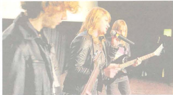
Utwór zespołu Rammstein wykonany po niemiecku zabrzmiał prawie jak oryginał

► W konkursie piosenki obcojęzycznej, jaki odbył się w Polonezie, najchętniej śpiewano w języku angielskim