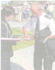
Każdy chciał mieć kawałek przeciętej wstęgi

Uczniowie Szkoły Podstawowej w Sierakowicach Prawych przygotowali program artystyczny dla strażaków.