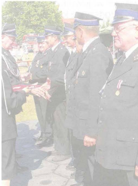
Jubileusz to okazja do odznaczenia najbardziej zasłużonych druhów