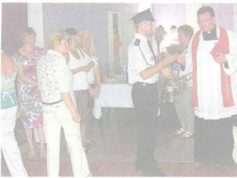
Świetlicę poświęcił proboszcz pszczonowskiej parafii

Ochotnicza Straż Pożarna w Pszczonowie została założona równo sto lat temu. Uroczystość jubileuszowa rozpoczęła się w sobotę mszą w pszczonowskim kościele, po której strażacy i zaproszeni goście przeszli na plac przed remizą. Jubileusz był okazją do oficjalnego otwarcia świetlicy wiejskiej, która powstała po modernizacji remizy strażackiej. Jednostka z Pszczonowa została uhonorowana Złotą Odznaką Związku OSP RP. Odznaczenia otrzymali również wyróżniający się druhowie Pszczonowa.