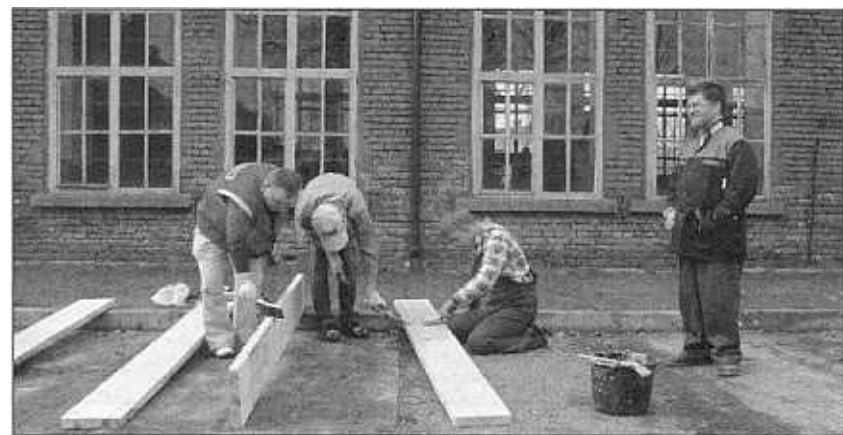
W przygotowywaniu sceny uczestniczyli podopieczni Warsztatów Terapii Zajęciowej.